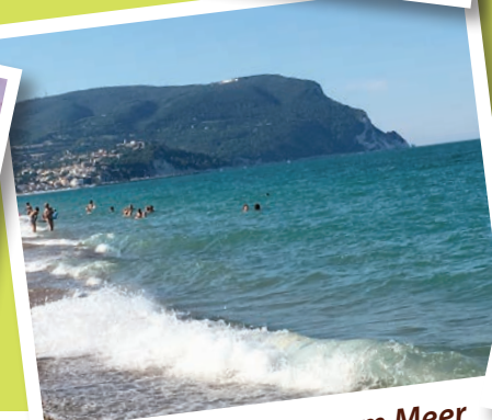
Ein sonniger Tag am Meer