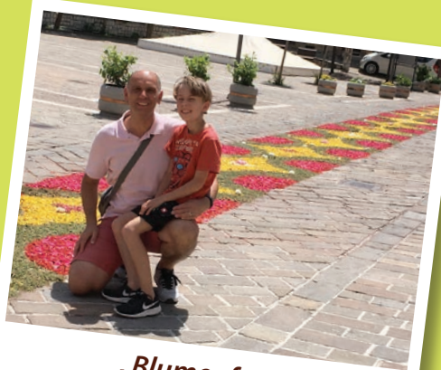
„Blumenfest“ in Cupramontana