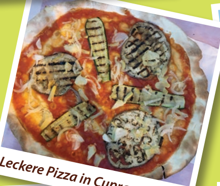
Leckere Pizza in Cupramontana