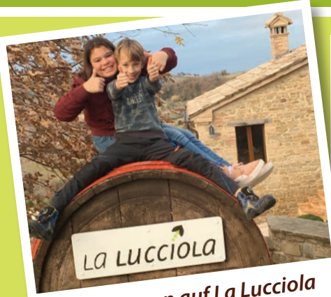
Willkommen auf La Lucciola