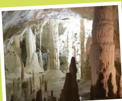
Ausflug zu den einmaligen Grotten von Frasassi