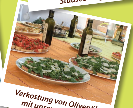
Verkostung von Olivenöl mit unseren Gästen