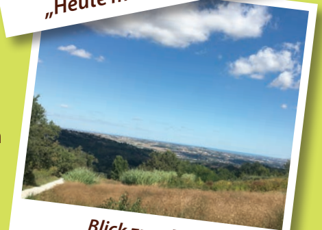
Blick zum Meer

Herzliche Grüße, Britta + Eduard + Letizia + Luca