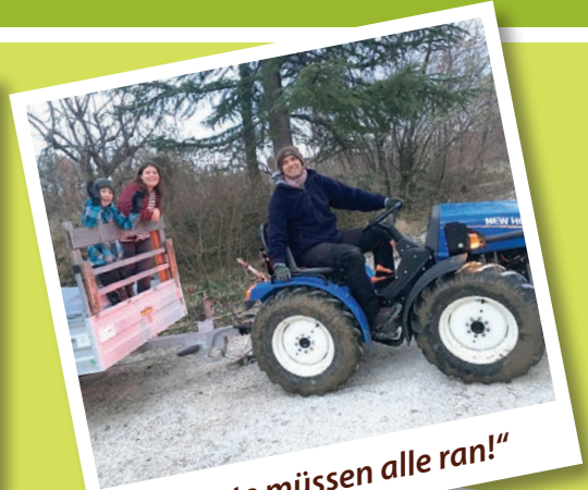
„Heute müssen alle ran!“