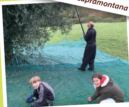
Olivenernte im November